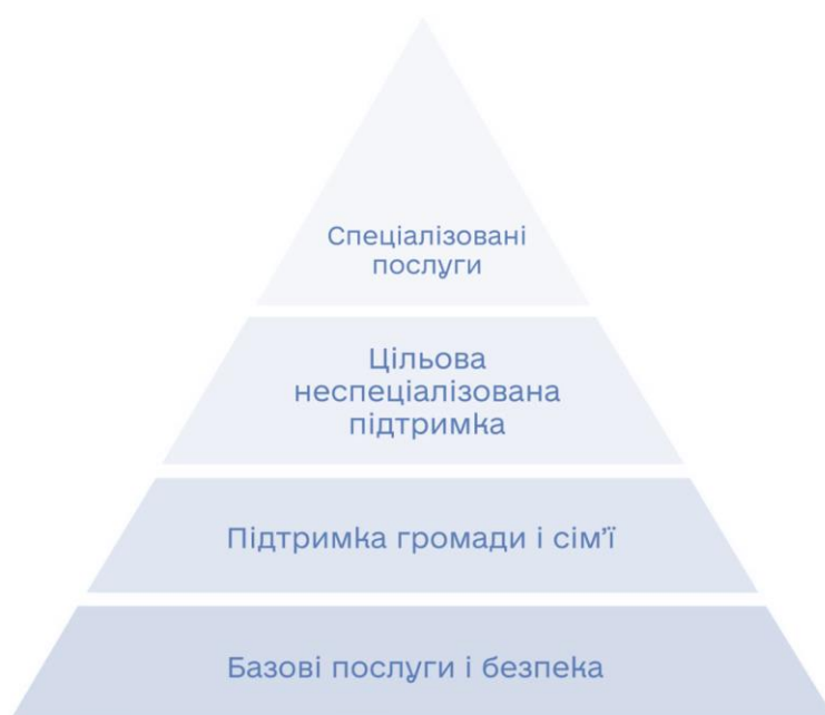
Рис. 1. Піраміда втручання для забезпечення психічного здоров'я та психосоціальної підтримки в надзвичайних ситуаціях (піраміда MHPSS) [1].

Представлена модель демонструє багаторівневу систему психологічної допомоги населенню в умовах кризових ситуацій. Основу піраміди становлять базові послуги та забезпечення безпеки населення, без яких неможливе ефективне відновлення психічного здоров'я. Наступні рівні охоплюють підтримку сім'ї та громади, фокусовану неспеціалізовану допомогу та спеціалізовані психологічні й психіатричні послуги. Аналіз схеми свідчить, що професійна діяльність психолога в умовах воєнного стану має комплексний характер і передбачає не лише кризове консультування, а й участь у процесах соціальної адаптації, психологічної реабілітації та формування психологічної стійкості населення [1].