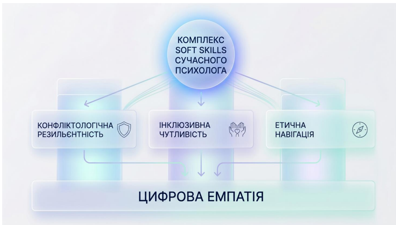
Рис. 2. Архітектура комплексу «м'яких навичок» (Soft skills) сучасного психолога на базі цифрової емпатії.

Таким чином, цілеспрямоване формування цифрової емпатії у майбутніх психологів виступає фундаментальною науково-методологічною умовою профілактики інформаційного вигорання та вихідним базисом для розбудови надійного інформаційного імунітету особистості. Розвинений цифровий емоційний інтелект дозволяє майбутньому експерту виступати в ролі публічного лідера думок та ефективного фасилітатора, який зберігає автентичні гуманістичні засади, принципи моральної відповідальності та людяності, нівелюючи ризики підміни справжніх інтерперсональних відносин квазі-емоційною взаємодією з алгоритмами.