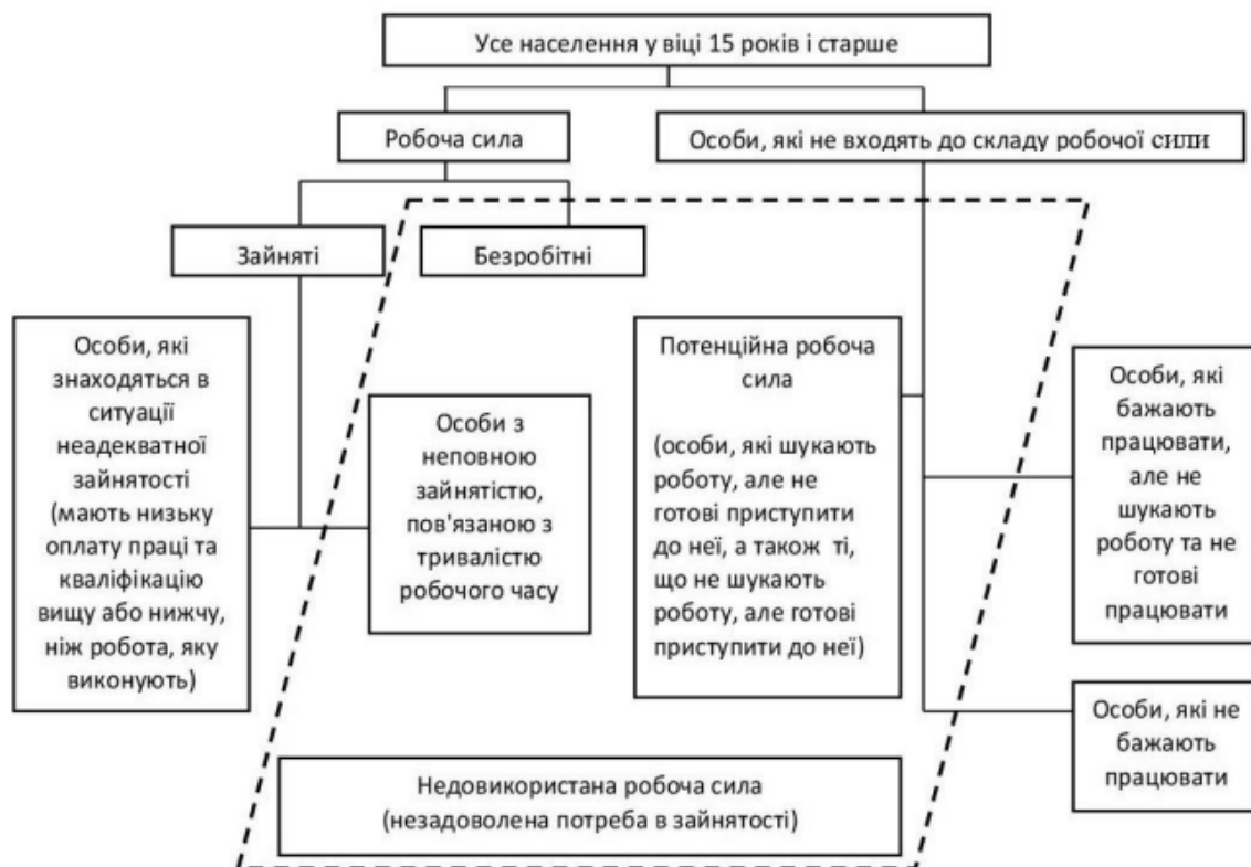
Рис. 1. Структуру населення за статусом участі в робочій силі та її недовикористання

Робоча сила (до 2019р. – економічно активне населення) – це населення обох статей у віці 15 років і старше (до 2019р. – 15–70 років), які впродовж обстежуваного тижня забезпечували пропозицію робочої сили на ринку праці. Зайняті та безробітні в сумі складають робочу силу.